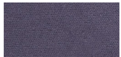
628 | Plata