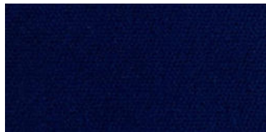
623 | Azul