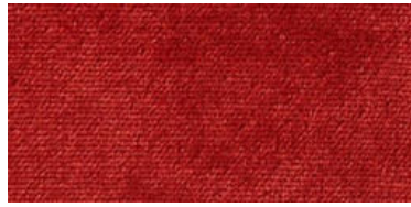
607 | Teja