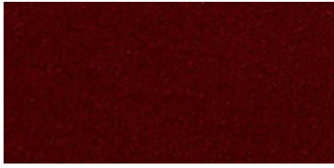
980 | Rojo teatro