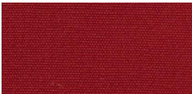
Saba 2 | 73