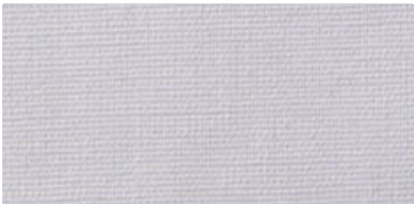
Saba 2 | 09