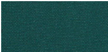
Saba 2 | 69