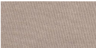
Saba 2 | 97