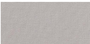
Saba 2 | 49