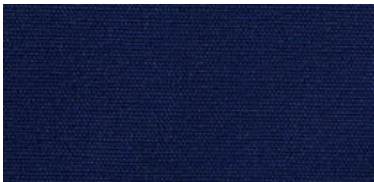
Saba 2 | 65