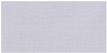
Saba 2 | 01