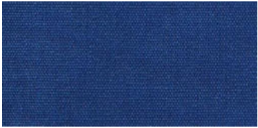
Saba 2 | 85