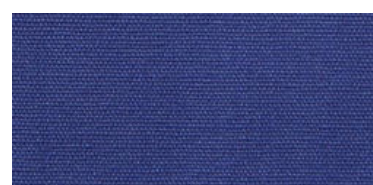
Saba 2 | 75