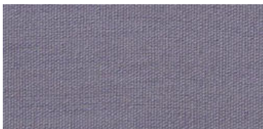
Saba 2 | 18