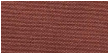
Saba 2 | 27