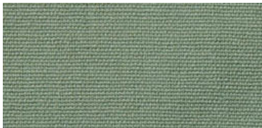
Saba 2 | E06