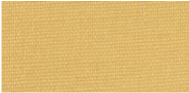
Saba 2 | 51