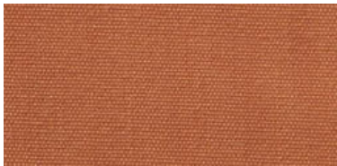
Saba 2 | 78