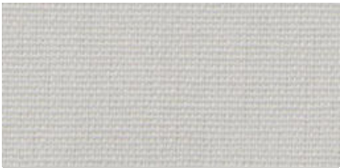
Saba 2 | 32