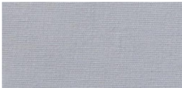
Saba 2 | 08