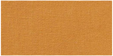
Saba 2 | 11