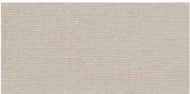
Saba 2 | 77