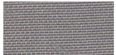
ELB | 11