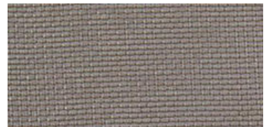
ELB | 03