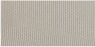
ELB | 02