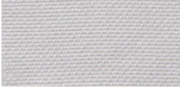
ELB | 01