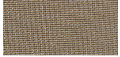
ELB | 06