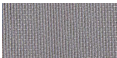
ELB | 14