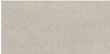
HIR | 02