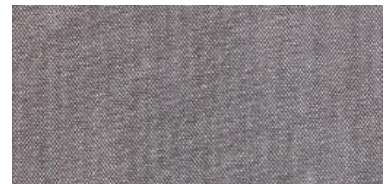
HIR | 08