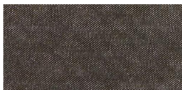
HIR | 05