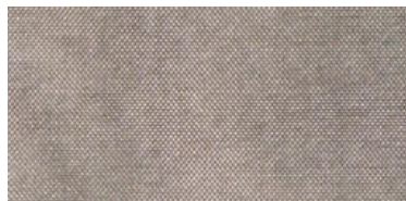
HIR | 06