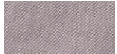
HIR | 07