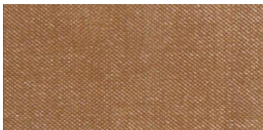
HIR | 09