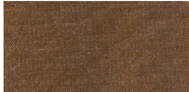
HIR | 04