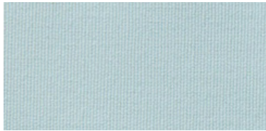
BE-2 | 35 C

El entorno hospitalario no sólo tiene que resultar lo más amable posible, requiere unas consideraciones de salubridad específicas. BERNIA CLINIC , además de su naturaleza FR, añade la cualidad Bio Active , una protección específica contra agentes patógenos. Los colores elegidos están especialmente pensados para entornos hospitalarios, geriátricos, de atención primaria y de urgencias.