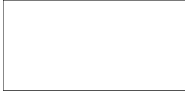
BE-2 | 09 C