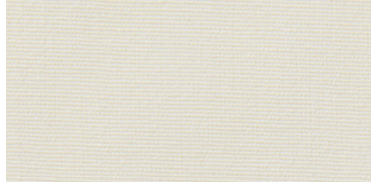
BE-2 | 32 C