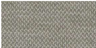
nina | 1123