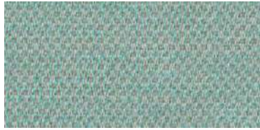
nina | 1105