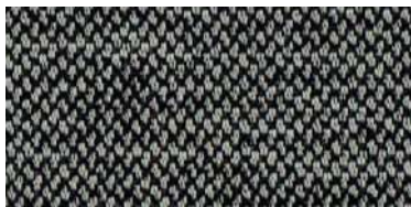
nina | 1129