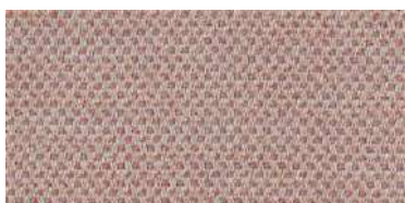
nina | 1104