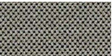
nina | 1119