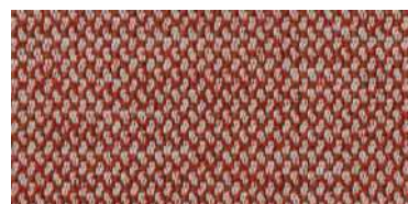
nina | 1124*