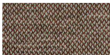
nina | 1126