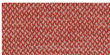
nina | 1114*