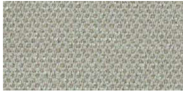
nina | 1113