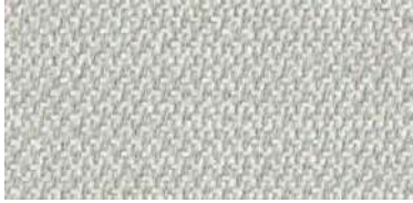
nina | 1100