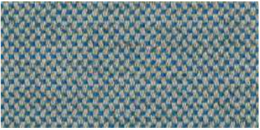
nina | 1125