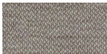
nina | 1127