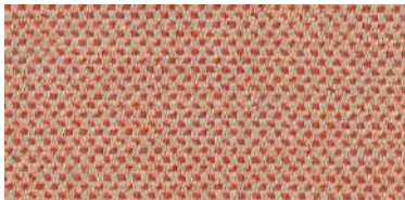
nina | 1117