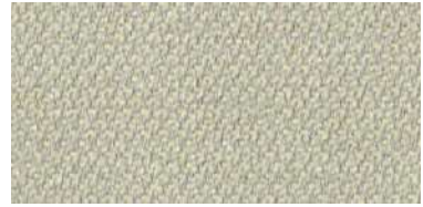
nina | 1101