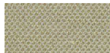
nina | 1102