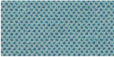
nina | 1115